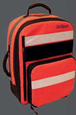
RESCUE I RETTUNGSRUCKSACK

EIN BEWÄHRTER KLASSIKER MIT PREIS-LEISTUNGS-GARANTIE