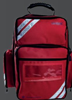
ultraRESCUE LITE RETTUNGSRUCKSACK Kompakt

DAS PLUS AN RAUM FÜR ZUBEHÖR, AED ODER PERSÖNLICHES EQUIPMENT