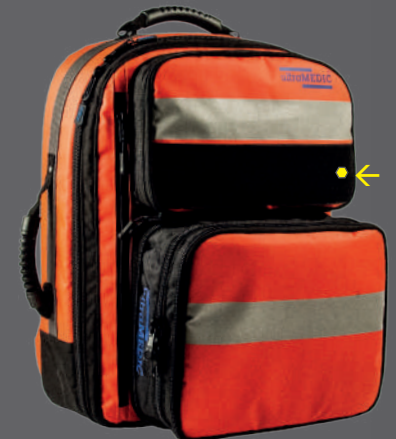
RESCUE I PLUS