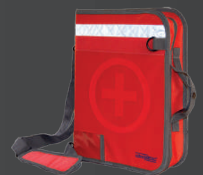
ultraDOC ROT DOKUMENTENTASCHE

WENIG PLATZ, VIEL MATERIAL? IHRE LÖSUNG - UNSER KOMPAKTER PLATZWUNDER-RUCKSACK.