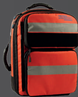
RESCUE I PLUS RETTUNGSRUCKSACK mit 1 Zusatztasche

EIN BEWÄHRTER KLASSIKER MIT PREIS-LEISTUNGS-GARANTIE